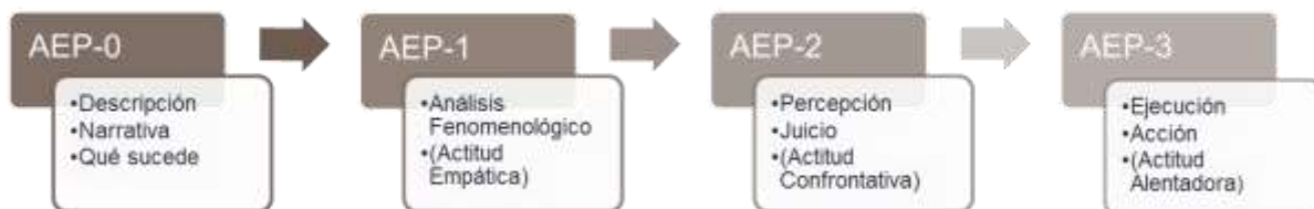
Figura 2. Un resumen de los pasos del procedimiento del AEP