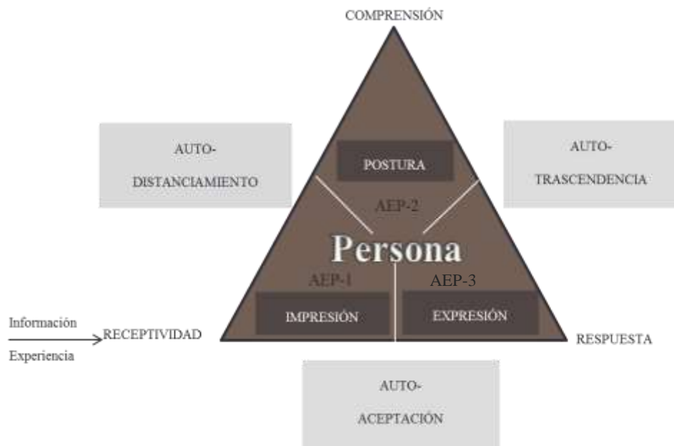
Figura 1. Marco Conceptual para el AEP, dentro de una Antropología Analítico- Existencial.